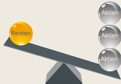
B&B Fonds - Dynamisch